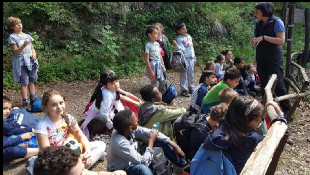
TROVIAMO UN' ANTICA CARBONAIA